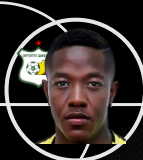
A. Romaña XP: 7.6