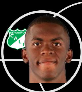
A. Colorado XP: 8.4