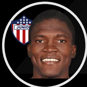
G. Mera XP: 8.8